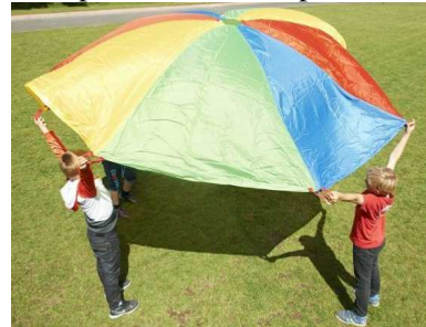
100 € Un parachute de coopération