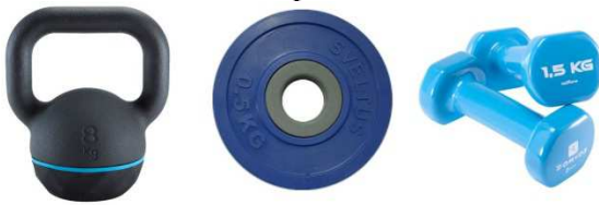
100 € Des poids