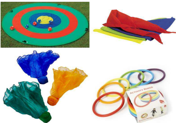
100 € Des accessoires de motricité fine