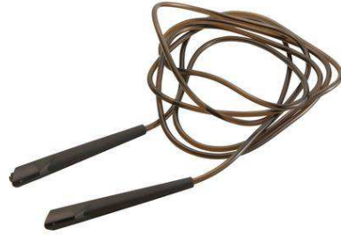
100 € Des cordes à sauter