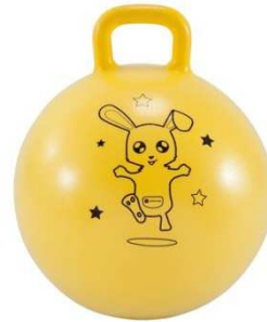
100 € Des ballons sauteurs