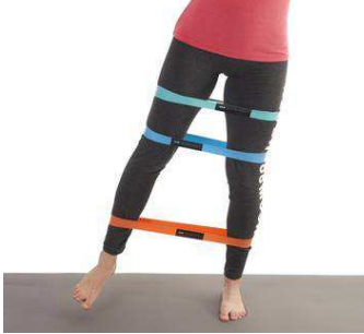
100 € Des élastiques de fitness