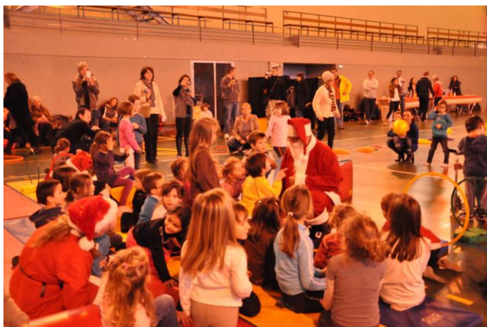
Le père Noël est venu rendre visite à tous les petits gyms