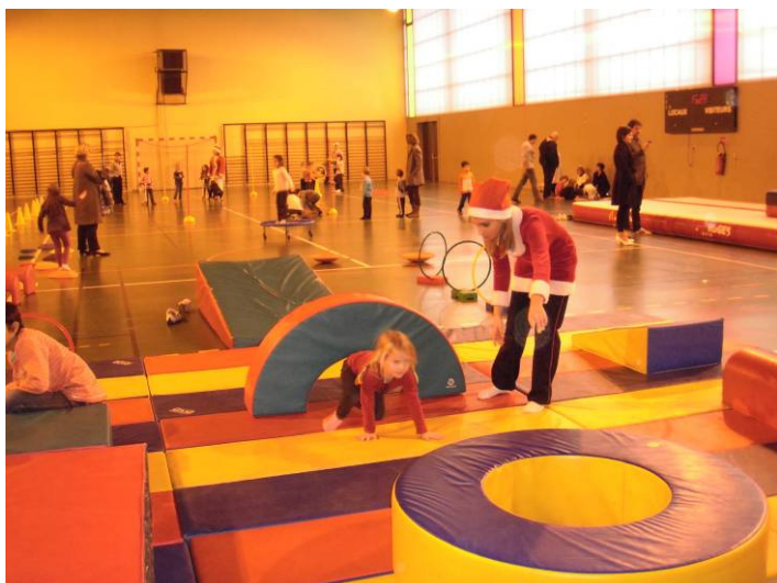
Découverte des modules pédagogiques