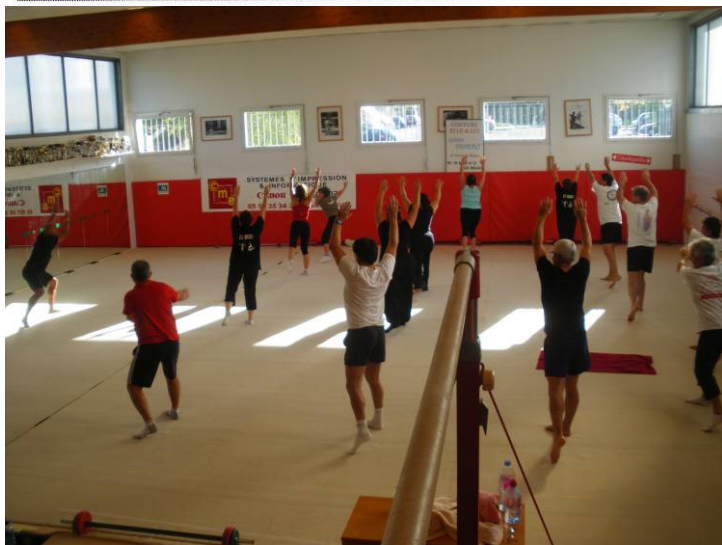
Trois cours sont au programme chaque semaine.