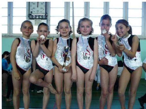
L'équipe N8 - 7/8