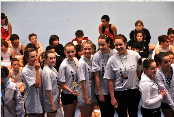
L'équipe N5 TC féminine qui a terminé première.