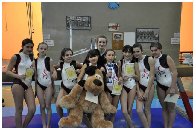
Les 2 équipes réunies