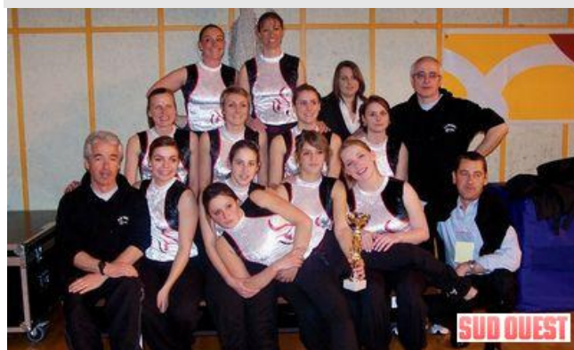
L'équipe Découverte Féminine mise à l'honneur dans le journal Sud Ouest.